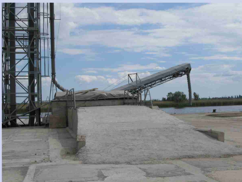
Зернопогрузочное отделение морского транспорта