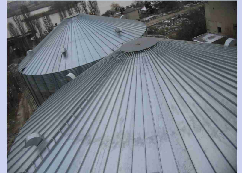
Конструкция крыши зернохранилища