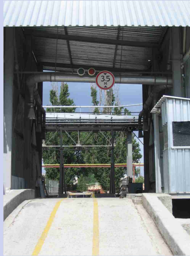
Зерноприемное отделение автотранспорта