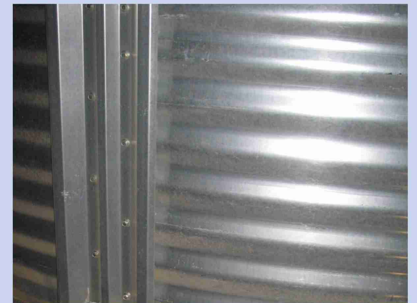
W-образное ребро жесткости и волнистая конструкция боковых стен зернохранилища