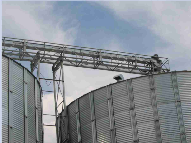
Зернотранспортная линия верхняя