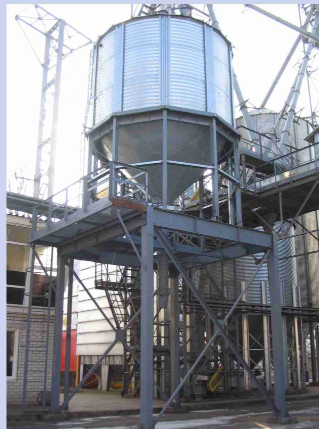
Зернопогрузочное отделение автотранспорта