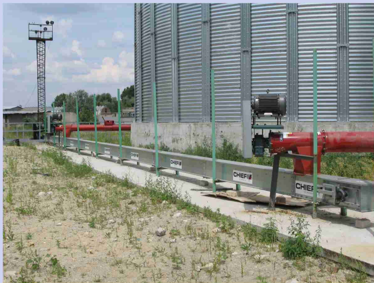
Зернотранспортная линия нижняя