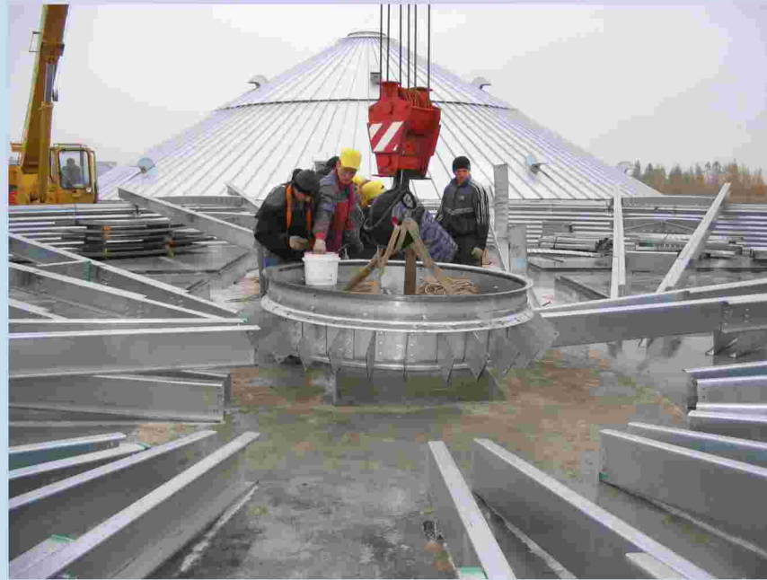
Этапы строительства зернохранилища