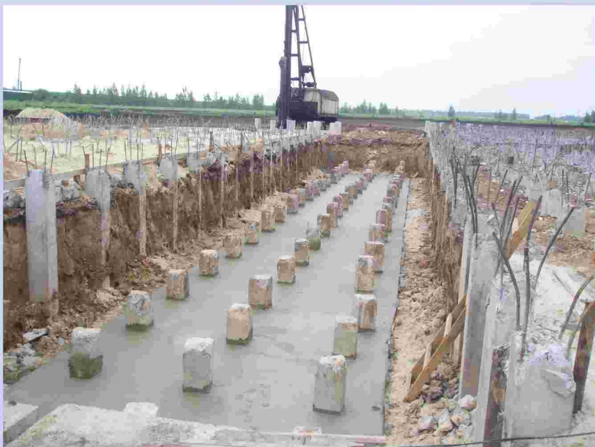
Свайное поле фундамента зернохранилища