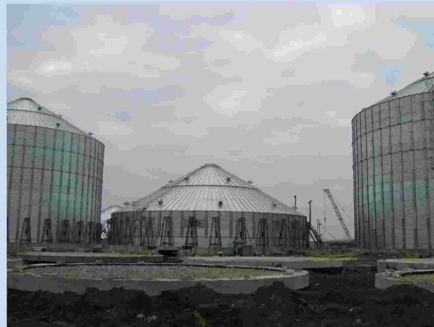
Монтаж емкостей зернохранилища